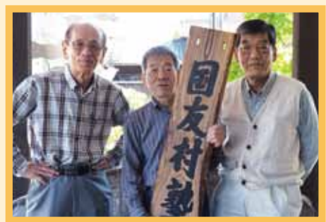
▲国友の地域遺産の伝承に励む70代メンバー